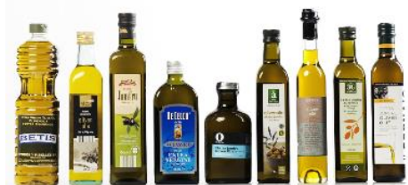
Olier, Honning, Marmelade, ...

Weightpack tilbyder unikke løsninger fra 2.000 til 45.000bph: